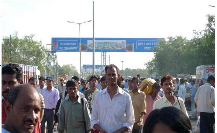
thank you for your visit to gurgaon