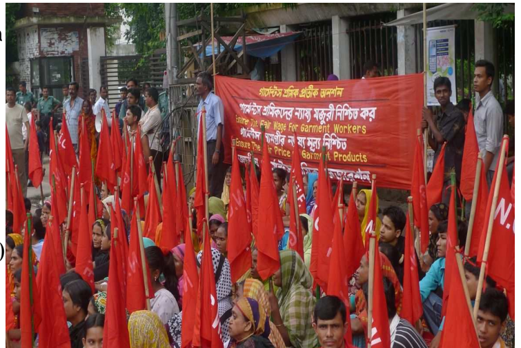
Chceme dostávat alespoň tu nejnižší spravedlivou mzdu!