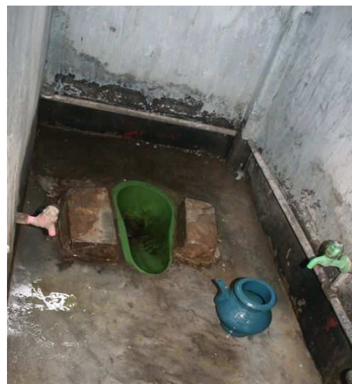
toaleta - jedna pro sto lidí