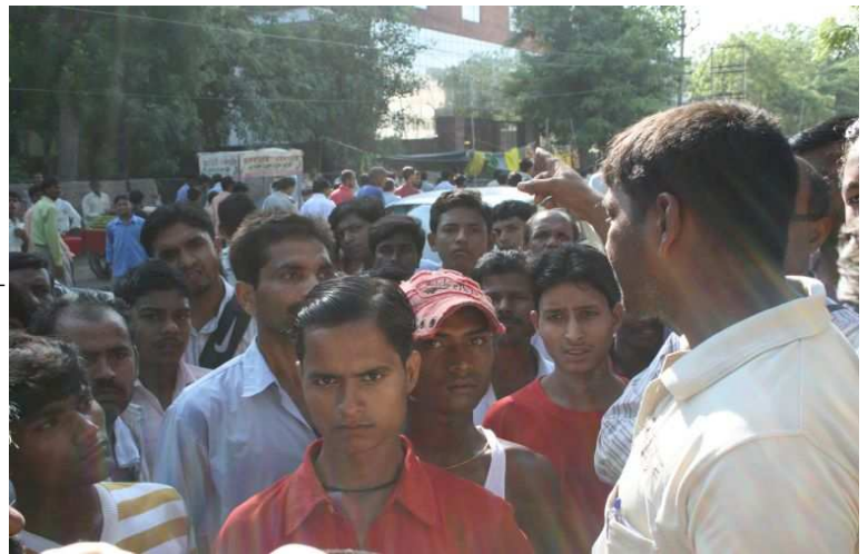
nábor do odborů